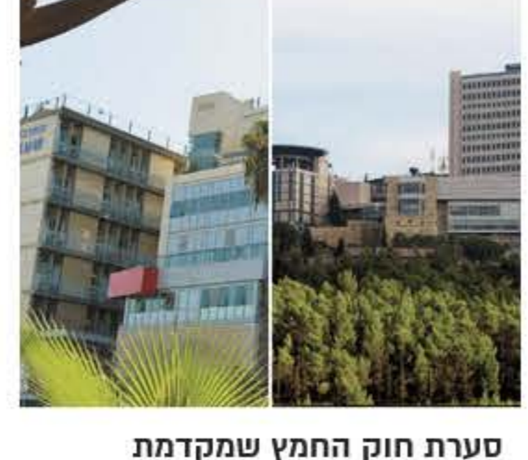
סערות חוק החמץ שמקדמת הממשלה - בעד ונגד מאת: חנית משה, לורה ורטון