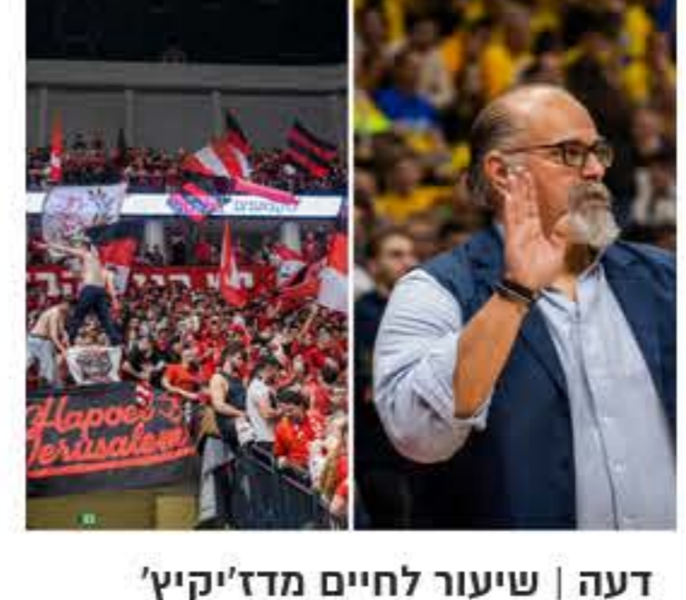
דעה | שיעור לחיים מד'קיק' מאת: עמית פוני