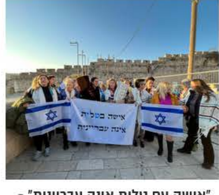
'אישה עם תולית אינה עבריינית' - של נשות הכותל בתפילה החדושת מאת: מערכת 'כל העיר'