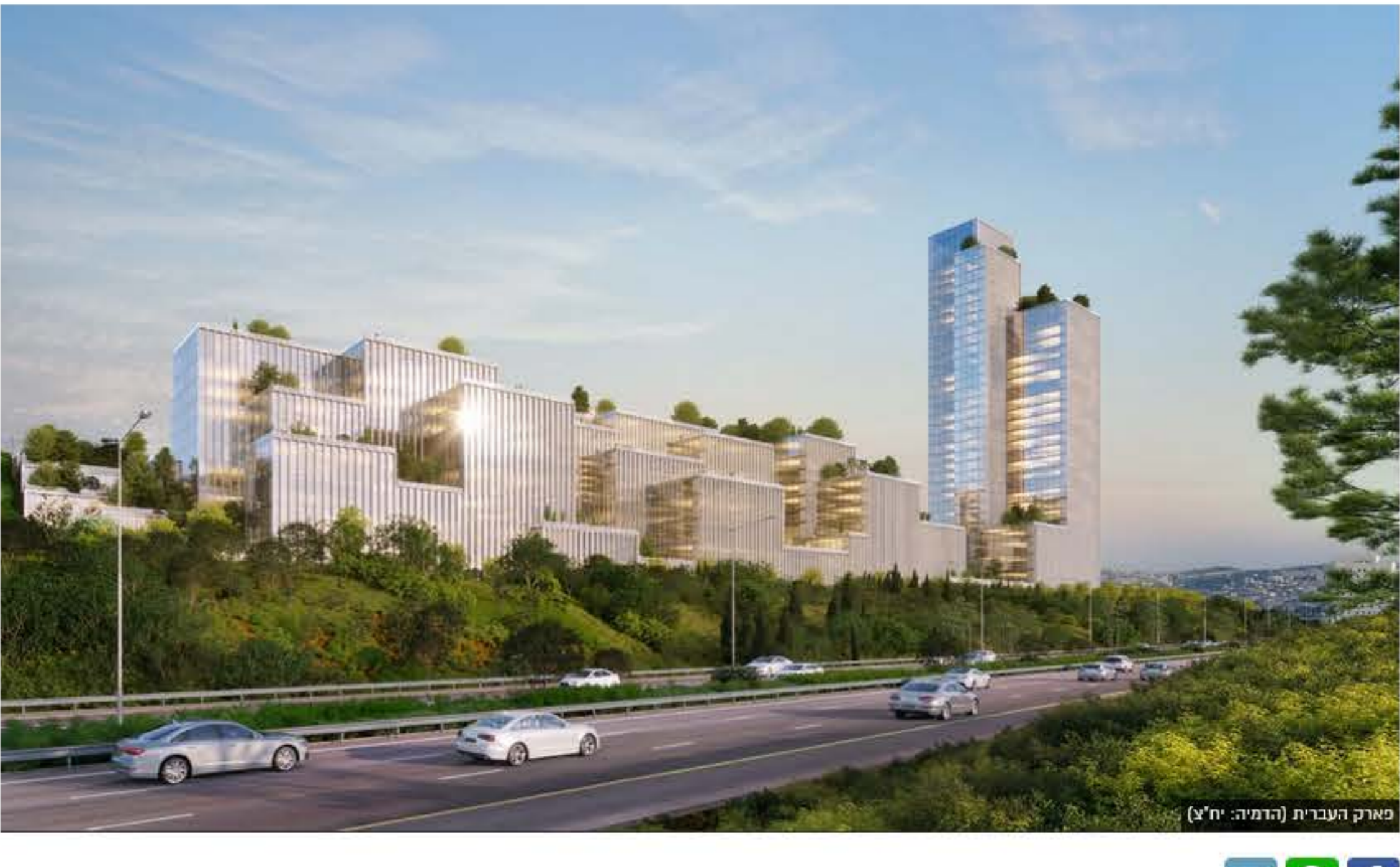
פארק העברית (הצפי: יו"א)