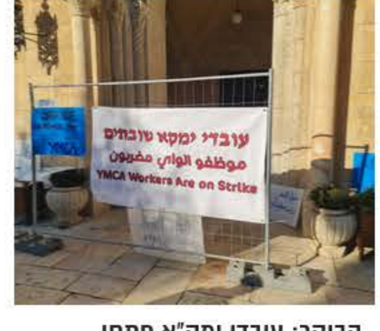
הבוקר: עובדי ימק'א פתחו בפעילות המוסד והשבתו את מאת: מערכת 'כל העיר'