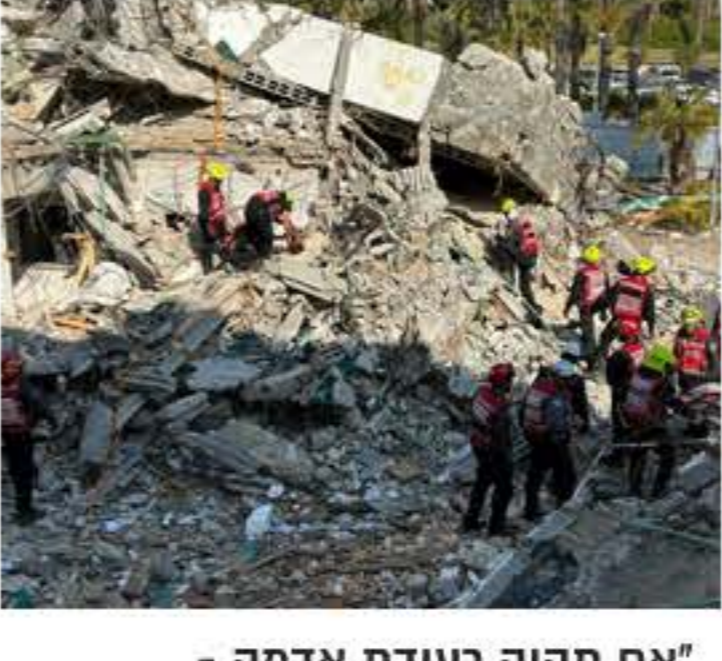
'אם תהיה רעידת אדמה - ירושלים תחווה אתגור מאוד משמעותי' מאת: רפי גמיש