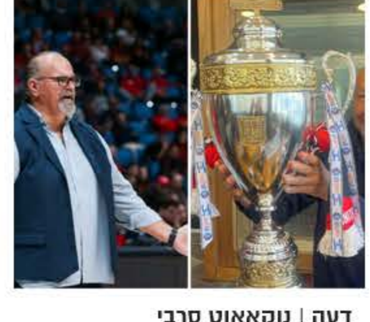
דעה | נקאאוט סרבי מאת: רמי מנדל