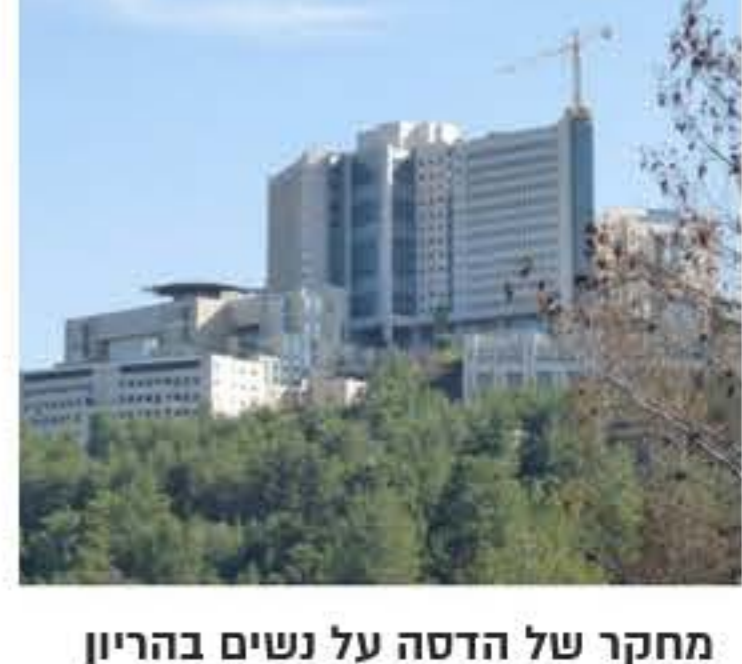
מחקר של הדסה על נשים בהריון שחלו בקורונה קבע: לידה התערבותית מוקדמת תסייע בהצלת חייהן של האימהות מאת: שירן טמזרטי