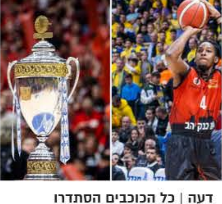
דעה | כל הכוכבים הסתדרו מאת: אור בוקר